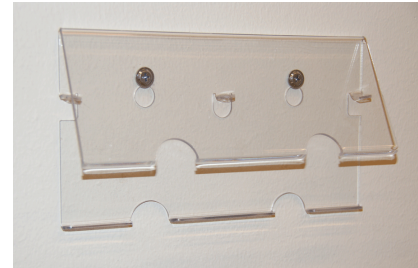
Art nr 2510- tom

Nya EasyOn plåster är enkla och bekväma att använda !!