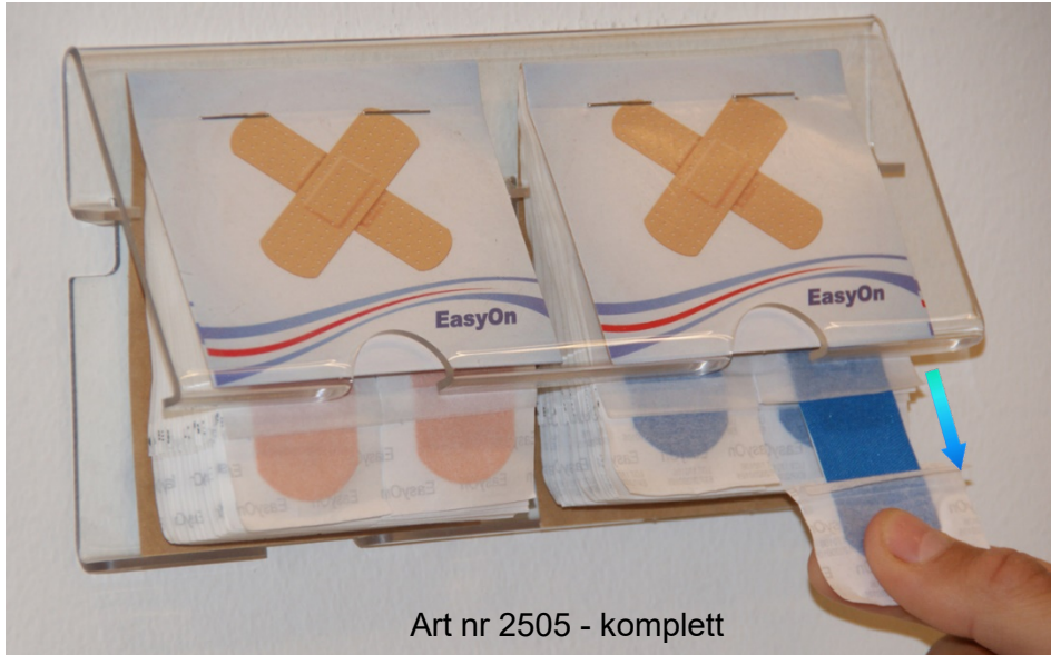
Art nr 2505 - komplett